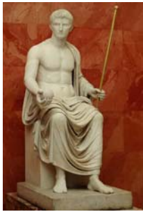
Октавиан Август в образа на Юпитер

емисии и постоянно я попълва със свои вноски. При новия режим старото републиканско устройство продължава да съществува – народните събрания, Сенатът, магистратурите продължават да съществуват, но само формално не претърпяват съществени промени. Сенатът и занапред остава висш държавен орган. Август прехвърля върху него законодателната и съдебната власт, която отнема от комициите. Той намалява броя на участниците в сената от 1000 на 600 души, които са предимно бивши негови офицери. Специален закон поставя и бариерата на имуществения ценз (не по-малко от 1 000 000 сестерции) за участие в него, както и условието някой от предците на кандидатите да е бил сенатор. Създаден е и специален орган, наречен Съвет на принцепса ( Consilium Principis ), който се съставява от 20 сенатори, избирани чрез жребий.