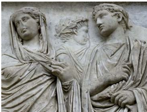
Ливия и Тиберий- фрагмент от релефа на Ara Pacis

наследодателя преминавали върху наследника. Наследникът встъпвал в правното положение на наследодателя, той ставал носител на правата и задълженията, които влизат в наследството. Той се явявал своеобразен продължител на личността на наследодателя. Когато наследниците били няколко, наследството се поделяло между тях. Делимите вземания и задължения се поделяли автоматично между сънаследниците съобразно с дела, който имал всеки сънаследник. За неделимите вземания и задължения се създавала активна, респективно пасивна солидарност между сънаследниците. Вещите, които били собственост на наследодателя, ставали съсобственост на наследниците. За да се достигне до реално поделяне на същите, необходимо било да се извърши делба. За тази цел всеки от сънаследниците разполагал по отношение на другите с иска actio familiae erciscundae .